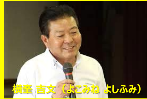
横峯 吉文 (よこみね よしふみ)